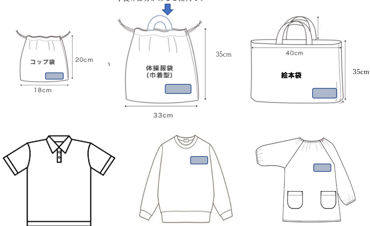
ポロシャツ 内側 に名前